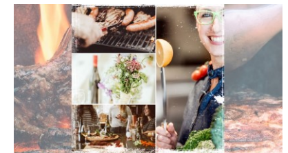
Show- und Eventcooking