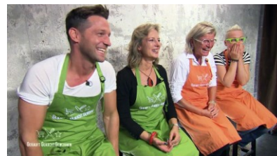
Gekauft gekocht gewonnen