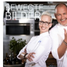
Kabel1 mit Rosin